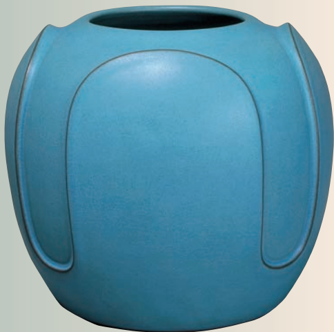
碧玉袖包花瓶 (昭和44年作)