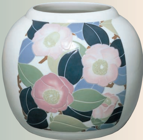
彩甍惜春花瓶 (昭和54年作)