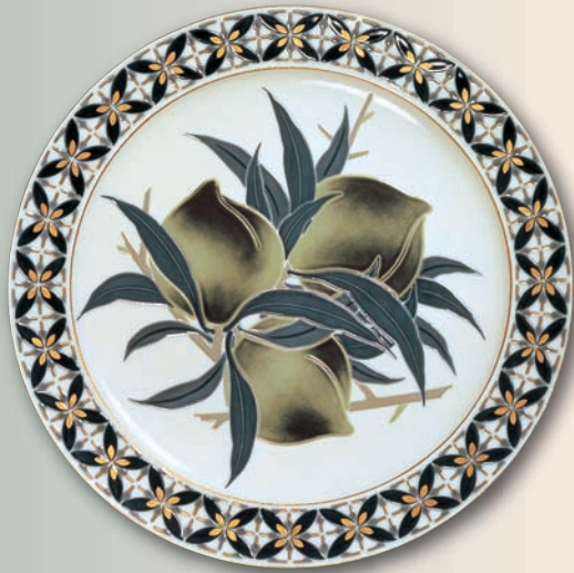
彩甍仙果萬歳飾皿 (昭和38年作)