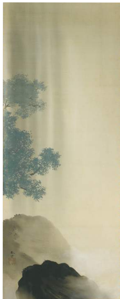
菱田春草「飛泉 双幅」左幅