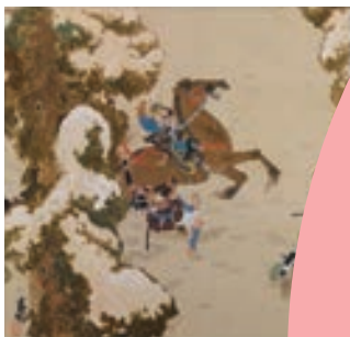
前田青邨「戦う若武者」