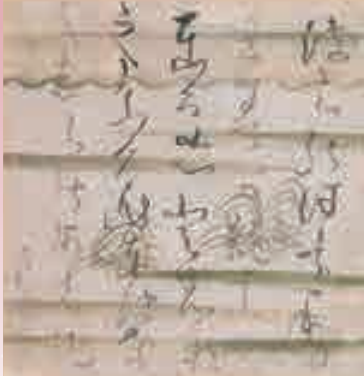
良寛「短歌一首 はちのこを云々」