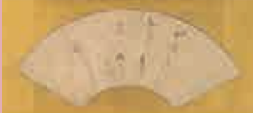
良寛「俳句一首 秋ひより千羽雀の羽音かな」