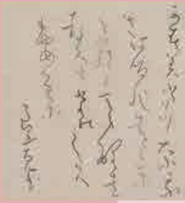
良寛「短歌一首 かすみたつ云々」