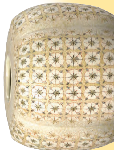
寺池 静人「花小紋花瓶」