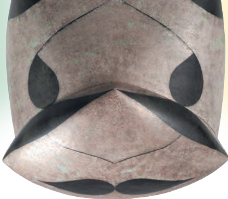
栗木 達介「黒釉 銀緑彩文 蓋器」