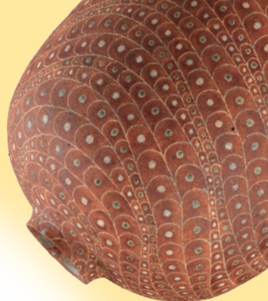
加守田 章二「彩陶壺」