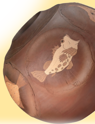
今井 政之「象嵌彩窯変 瀬戸の魚 花壺」