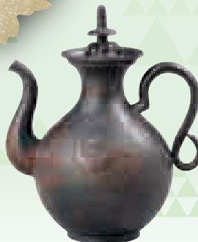
佐々木 象堂「銅 鴛鴦文水注」