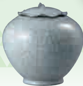
三浦 小平二「青磁 飾り壺」