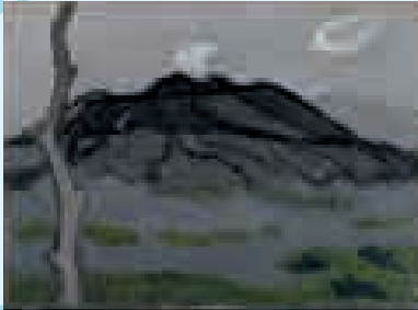
小野 末「山 三原山・冬」