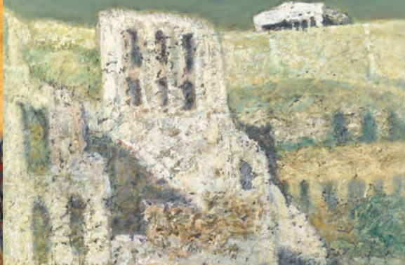
小野 末「ギリシャ アクロポリスの丘」