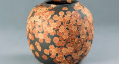
5代 伊藤赤水(赤儘)「無名異 練上花紋 壺」