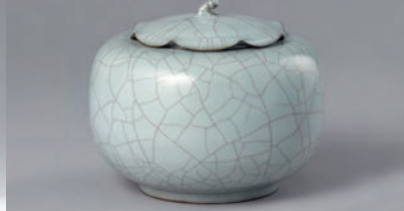
三浦 小平二「青磁 折りつみ 飾壺」