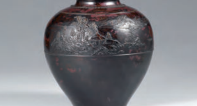
3代 本間琢斎「斑紫銅 山水詩文 花瓶」