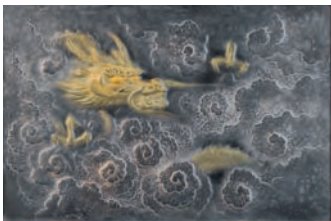
亀倉 蒲舟「彫金十二支辰」