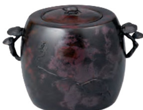
3代 本間 琢斎「斑紫銅 亀・俳句文水指」