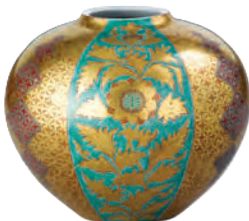
寺池 陶杯「金欄手花瓶」